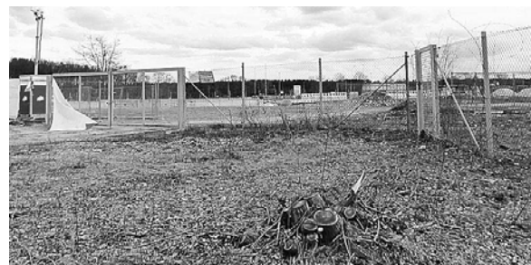
Der Bau der Entladeanlage für fremde Salzwässer am Schacht in Wathlingen ruht nach Klageerhebung durch die BI Umwelt