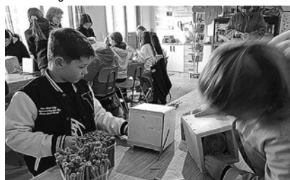
Die pflanzlichen Röhren wurden dann in Ruhe in den Innenräumen der Naturkontaktstation eingesetzt, da es draußen regnete