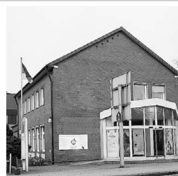
Im Erdgeschoss der ehemaligen Sparkasse (Bahnhofstraße 2) befindet sich jetzt das NEUE RATHAUS der Gemeinde Nienhagen

Ja, es hat schon einige Monate gedauert, um aus dem Gebäude der ehemaligen Sparkasse das NEUE RATHAUS zu gestalten. Jetzt aber ist es soweit und wir können das Haus beziehen. Das „NEUE RATHAUS“ ergänzt das „ALTE RATHAUS“, in dem jetzt verschiedene Teile der Samtgemeinde mehr Platz und Raum haben. Und das Rathaus der Gemeinde