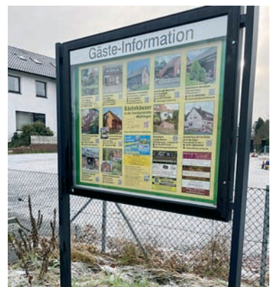
Nienhorst an der ehemaligen Müggenburg