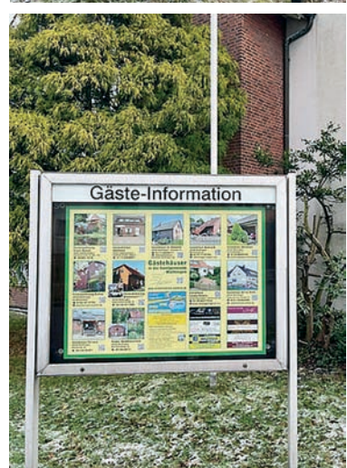
Wathlingen an der katholischen Kirche