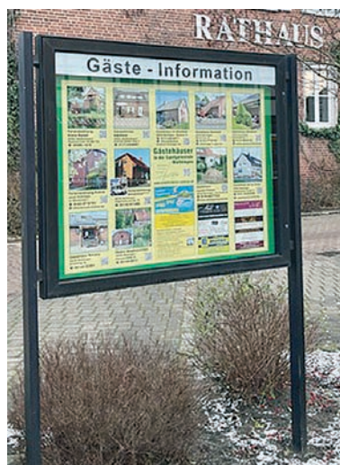
Nienhagen am Rathaus

Die Vermieter von Gästezimmern und Ferienwohnungen in unserer Samtgemeinde erhalten eine neue Außerdarstellung! Sowohl der Internetauftritt unter www.verkehrsverein-nahdran.de , als auch Werbeanzeigen in den vier Schaukästen an markanten Stellen in den Gemeinden wurden aktualisiert und erneuert.