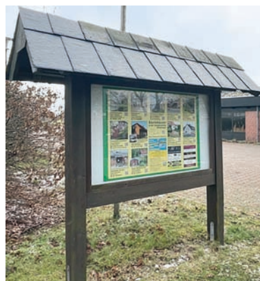
Großmoor am Dorfgemeinschaftshaus