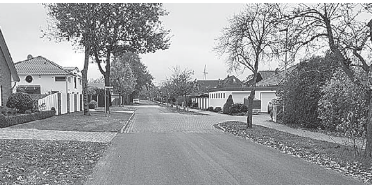
In diesem Bereich des Göschenkamps (linke Seite) wird demnächst die abgängige Heckenpflanzung als Ersatz vorgenommen.

einstimmige Beschlusslage des Rates um. In diesem Zusammenhang weisen wir nochmals darauf hin, dass das Abparken von Kraftfahrzeugen im unbefestigten Seitenraum der Gemeindestraßen, also auch hier im Bereich Göschenkamp, untersagt ist. Die Seitenbereiche sind Versickerungsflächen, die durch das ständige Befahren mit Fahrzeugen verdichtet werden und somit gerade bei Starkregenereignisse das Wasser dort nicht mehr abfließen kann. Vielen Dank, dass Sie diese Vorgabe beachten, vielen Dank für Ihr Verständnis zur baldigen Heckenpflanzung. Herzliche Grüße aus dem Rathaus Jörg Makel, Bürgermeister