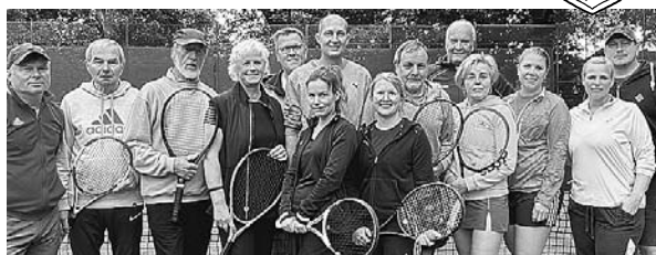
Beim Saisonabschlussturnier griffen die Wathlinger Tennis-Asse noch einmal unter freiem Himmel zum Schläger.

Noch einmal Matches unter freiem Himmel: Beim Saisonabschlussturnier schwangen die Tennis-Asse des TC Wathlingen mehrere Stunden den Schläger, gespielt wurden Mixed und Doppel. Insgesamt 15 Spielerinnen und