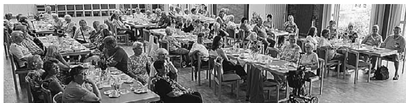
Über 60 interessierte Mitglieder und Gäste waren trotz der hochsommerlichen Temperaturen in den Hagensaal gekommen

fen Ernährung, Bewegung und Sport, Duschen und Schwimmen oder Reisen. Dies erläuterte Kerstin Kucz umfassend und sehr verständlich an Beispielen und gab auch praktische Tipps. Wichtig sei dabei, so Kucz: „Der Körper ist der Chef, nicht der Kopf.“ Die Anwesenden waren sehr beeindruckt und bedankten sich bei Kerstin Kucz für den sehr kompetenten und hörenswerten Vortrag. Gut gerüstet wurde sich beim anschließenden gemütlichen Beisammensein mit Kaffee und Kuchen noch darüber ausgetauscht. Mit vielen anregenden Gesprächen ging der Info-Nachmittag bei hochsommerlichen Temperaturen zu Ende.