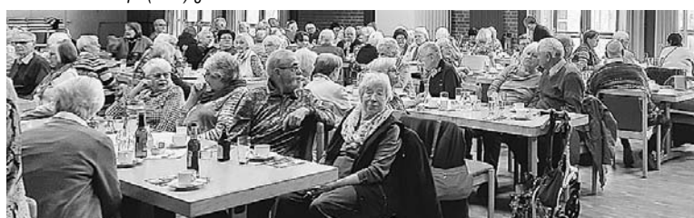
Über 80 Mitglieder und Gäste waren zum Info-Nachmittag des SoVD Ortsverbandes Nienhagen in den Hagensaal gekommen