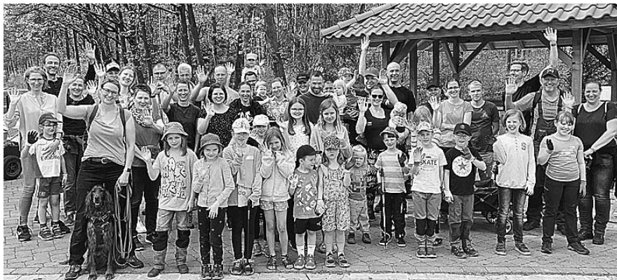
Ein große Sammlertruppe trifft sich bei der Schutzhütte an der Waldstraße.

Vorläufer-Sammlungen von 1986 und 1988 dokumentiert sind. Das Ende fand dieses erfolgreiche Ereignis in der ASV-Begegnungsstätte.